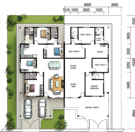
PELAN LANTAI : RUMAH BERKEMBAR SETINGKAT - JENIS A