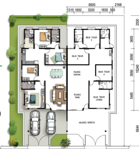
PELAN LANTAI : RUMAH BERKEMBAR SETINGKAT - JENIS B