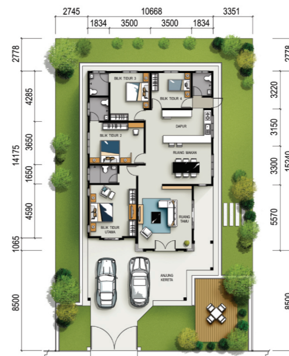
PELAN LANTAI RUMAH BANGLO SETINGKAT