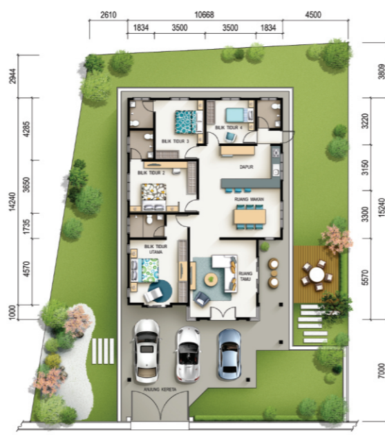
PELAN LANTAI RUMAH SESEBUAH SETINGKAT