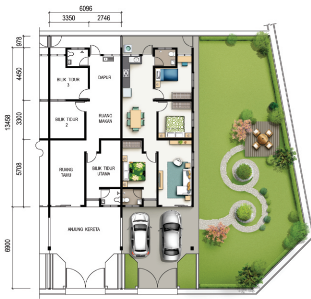
PELAN LANTAI RUMAH TERES SETINGKAT