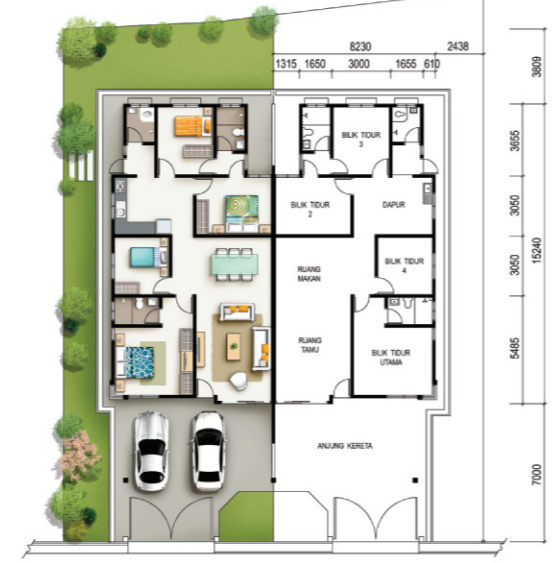
PELAN LANTAI RUMAH BERKEMBAR SETINGKAT - JENIS B