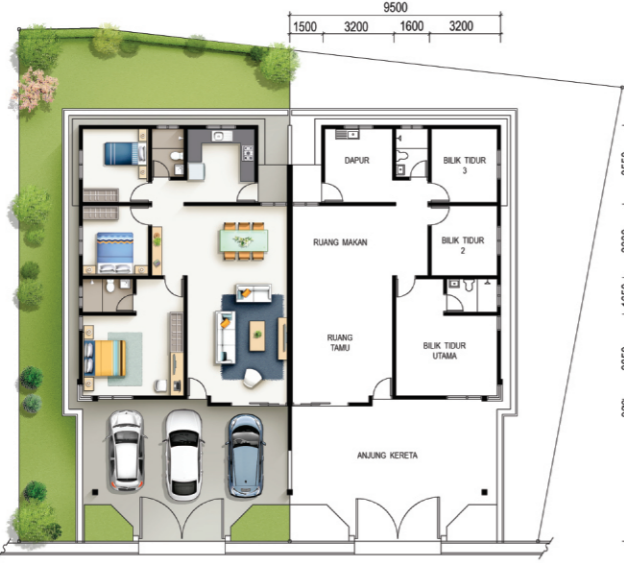
PELAN LANTAI RUMAH BERKEMBAR SETINGKAT - JENIS A